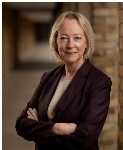
リンダ・グラットン先生 ロンドン・ビジネス・スクール経営学教授

概要： https://mirai-sensei.info/20230819-4-sent/