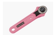
ロータリーカッター