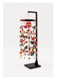
オリジナル 木製つるし台

【さらに!】4号以降毎号 150 円 (税込) を追加するプレミアム定期購読では、完成したつるし飾りをお部屋に飾って楽しめる『オリジナル木製つるし台』をプレゼント!