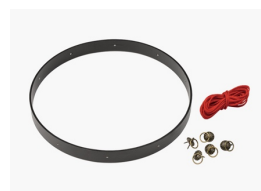
つるし飾り用下げ輪