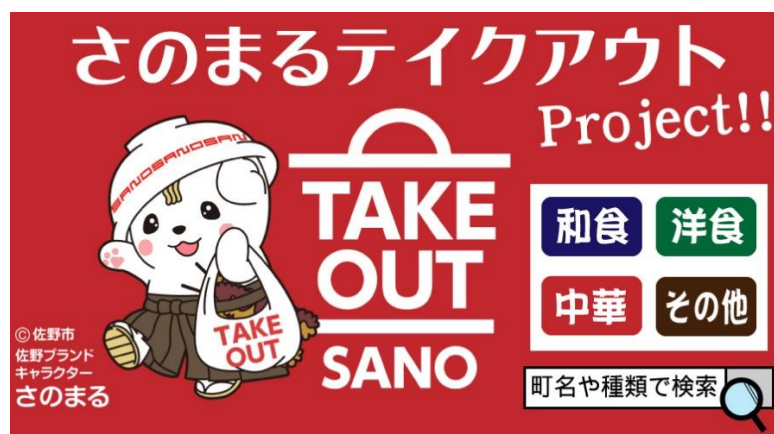
▲さのまるテイクアウトプロジェクトのイメージ画像

今後も当社は本プロジェクトを通じて、佐野市内飲食店の収益増、ひいては佐野市の活性化に取り組んでまいります。