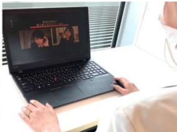
▲オンライン上のロールプレイングの様子

・在宅勤務期間においても新卒社員が一定の営業スキルを獲得できるとともに、動画 SNS 上にロールプレイング動画を投稿することで、新入社員と既存社員間のコミュニケーションの場としても活用した。 ・新入社員に対して行ったアンケート結果では、約 9 割がオンライン研修でも同期とのつながりを感じたと回答、また実践を想定したロールプレイングを取り入れたことにより満足度は約 8 割超という結果になった。