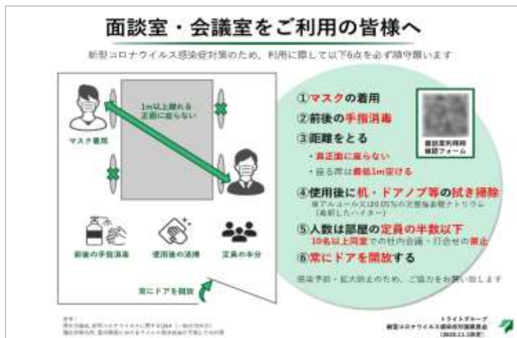
▲トライトグループ面談室の利用ルール・チェックシート

新型コロナウイルス感染症の拡大が深刻化した 2 月、社内で迅速な情報共有・対応を行うことを目的にコロナ対策委員会を発足。全社員が安心して勤務できる環境整備とルールを設定を行った。