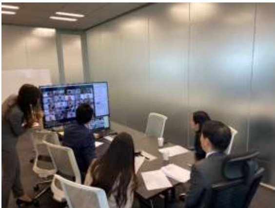
▲オンライン入社式の様子

・新型コロナウイルス感染症拡大を受け、2020 年 4 月の新入社員約 200 人の受け入れに関して、当初対面で予定していた入社式と研修をオンラインに移行するため、3 週間でオンライン用の研修プログラムを開発し、実施まで行った。研修では「成長意欲をもった新入社員の形成」をテーマに、業務に関する営業スキルや基本的なビジネススキル全般に関する e-Learning、業界知識に関する課題図書、オンライン上でのロールプレイング大会を開催した。