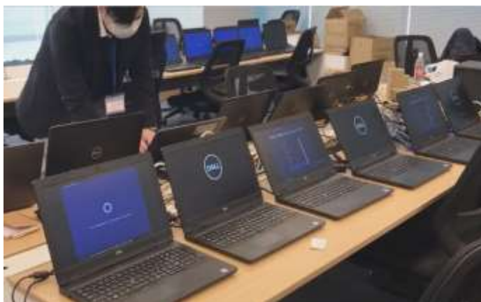
▲テレワークに向け PC のセットアップ準備を進める様子

・4 月の緊急事態宣言発令から 2 か月間、全社員がテレワークに移行した。宣言解除後は段階的な出勤緩和を行いながら、小さい子供がいるなどの不安な社員に関してはテレワークでの勤務を推奨しており、コーポレート部門に関しては現在も在宅勤務とオフィス勤務を合わせた勤務形態としている。