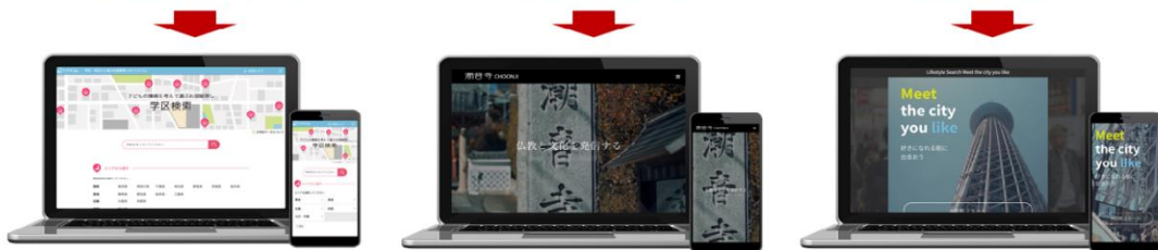
(大学生ビジネスコンテストの様子)