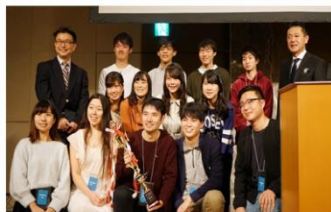
2017年11月 第一回大学生ビジネスコンテスト開催 ＜入賞企画＞ 「子どもの環境から住まいを選ぶ」