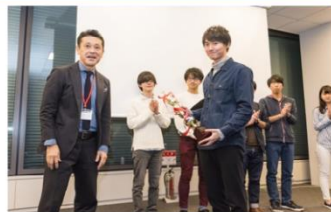
2018年11月 第二回大学生ビジネスコンテスト開催 ＜入賞企画＞ 「お寺の遊休スペース活用“宿坊”」