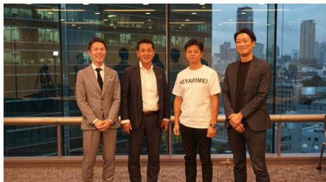
(REAN JAPAN メンバー写真)

2020年12月から、不動産賃貸仲介業のさらなる発展のため、不動産賃貸仲介業の未来をつくる研究会として「REAN JAPAN」を発足しました。競合する企業と連携し、不動産賃貸業ネットワークの多岐に渡る情報を共有することにより、賃貸仲介業に携わる人材が今まで以上に働きがいを感じることができるような環境を整備することが大切だと考え、成功した人たちの知識と一緒に研究・勉強しています。このような知識をYouTubeで発信しており、様々な会社の面白い取り組みや成功事例などを広く共有しています。