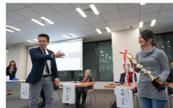
2019年11月 第三回大学生ビジネスコンテスト開催 ＜入賞企画＞ 「家ではなく、街に住む」