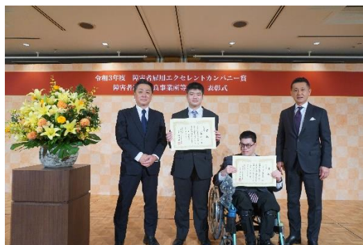
(障害者雇用優良事業所表彰の様子)

賃貸仲介業のみの知識だけでは魅力的な会社へと成長することは困難だと考え、2018年から社内プロジェクトを開始しました。まずは、本社の役職など関係なくメンバーを集め、「好きなことをやってほしい」と伝え、週1回、1時間程度集まり本プロジェクトを進めています。