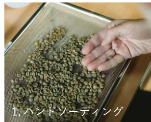
1, ハンドソーティング