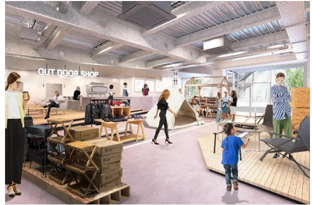
▲ショップイメージ

また 3 階以上の各フロアにはテラスを配置し、利用者にとって開放感ある心地よい空間を実現。仕事合間のリフレッシュやコミュニケーションの場としてはもちろん、オープンエアの打ち合わせスペースとしても利用可能です。