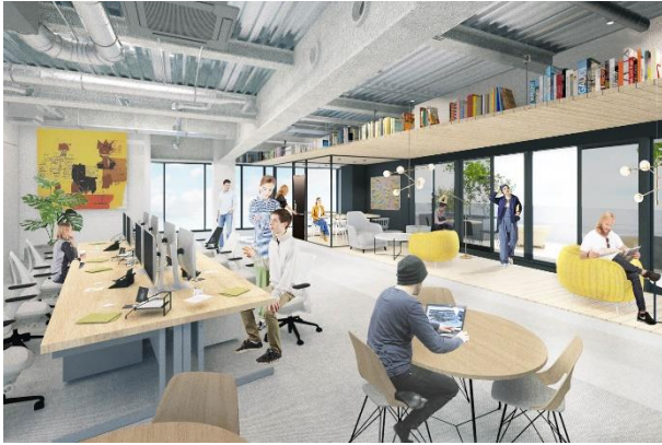
▲オフィスイメージ