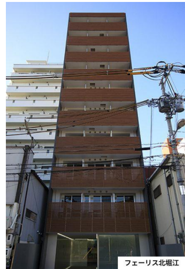
フェーリス北堀江