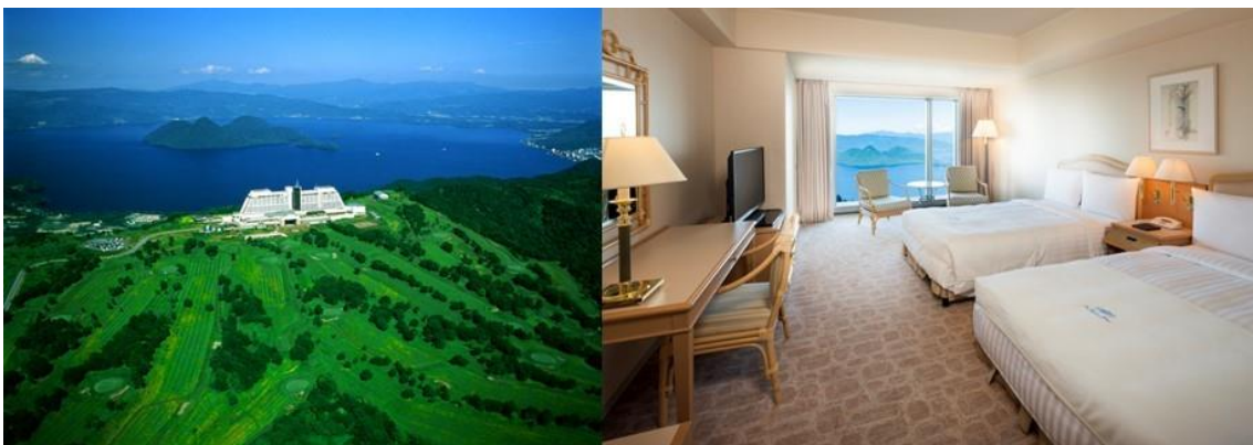
2008 年洞爺湖サミットの会場ともなった「ザ・ウィンザーホテル洞爺宿泊券」

洞爺湖町はユネスコ世界ジオパークと世界文化遺産、2 つの世界的な遺産を有する全国でも稀有な町です。その町の特徴を生かして、海産物や農産物だけではなく、近年、全国的に人気の高い“コト消費”の返礼品を開発していくことを計画しています。そのために、町長自らが広告塔となって、積極的に全国の寄附者や洞爺湖町に訪れた方々にアピールしていく予定です。特に今年 5 月に開催される「洞爺湖マラソン」や 6 月に開催される「TOYAKO マンガアニメフェスタ」では、イベント内での返礼品提供もありつつ、町長自らコスプレして町と町への寄附についてアピールしていきます。