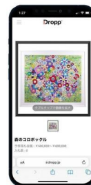
② オークション・抽選・Buy Nowに参加する