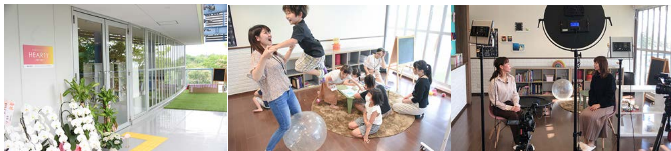
写真左から：HEARTY 外観 / HEARTY 内観 / KBS 京都テレビ「谷口流々」取材の様子