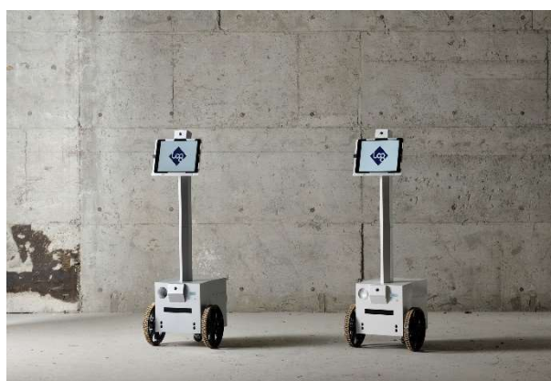
log build 社の施工管理ロボット「Log Kun (ログくん)」(左)