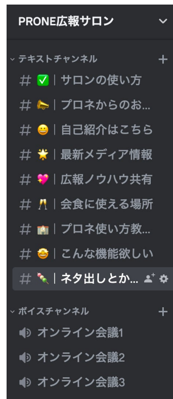
▲広報サロンの9つのチャンネル（広報お役立ち情報収集が可能）

*関連プレスリリース： https://prtimes.jp/main/html/rd/p/000000020.000046649.html