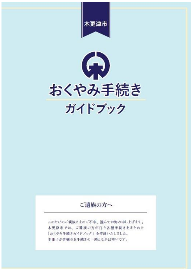
↑ 「おくやみガイドブック」表紙