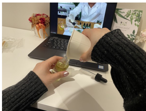
（画像右）手作りヘアオイルのワークショップ風景。参加者は画面越しに説明を聞きながら体験