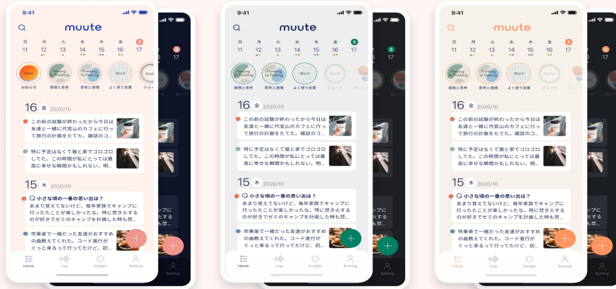
2つの新しいカラーテーマを追加し、ダークモードに対応