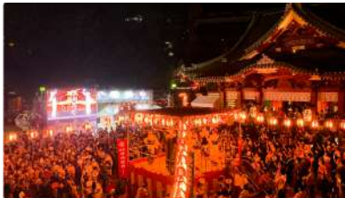
ふいすぼっ！× 神田明神納涼祭り