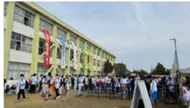
ふいすぼっ！文化体育祭