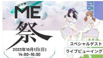
MEキャンバス × Palette Project