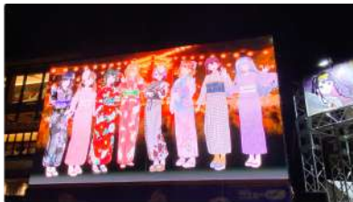
ふいすぼっ！× Palette Project