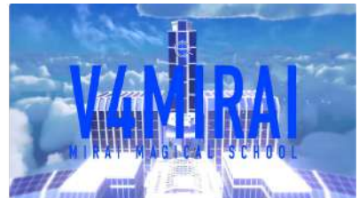
MetaLab × V4Mirai

今後も既存事業のさらなる成長と新たなビジネス創出のため、経営統合、資本提携を通じたインオーガニック成長を重要戦略のひとつに位置づけ、取り組みを強化してまいります。Brave groupとの経営統合、資本提携についてご興味のある方は是非お問い合わせください。