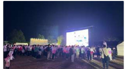
ふいすぼっ！文化体育祭