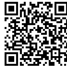
-片づけ例②～子どもと片付け～