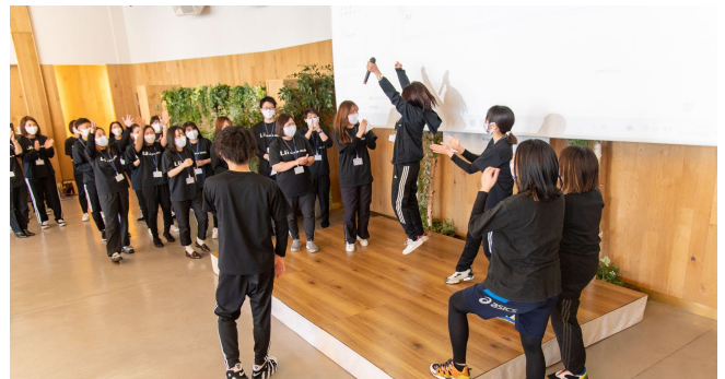
▲左会場イメージ写真、右全社会議冒頭10分のアイスブレイク風景(2022年11月)