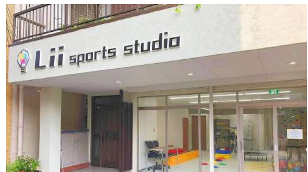
▲左：「Lii sports studio八王子」内観イメージ図 右：名古屋店(1号店)の外観