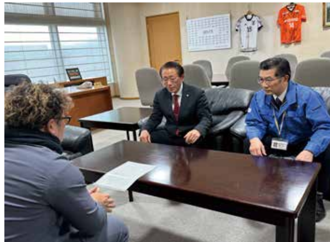
菰野町長と副町長に支援の報告へ伺った時の様子

～萬古焼の窯元 山口陶器が、伝統産業を担う輪島市の危機的状況に支援を開始しました～