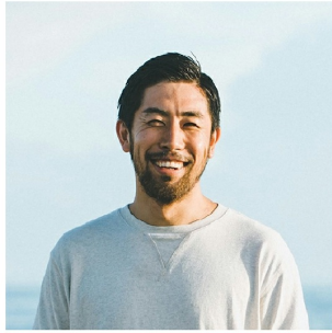
Next Commons Lab ファウンダー 社会彫刻家