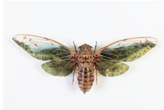
「かつて風景の一部だったものに、風景をプリントする。」 岩崎 広大