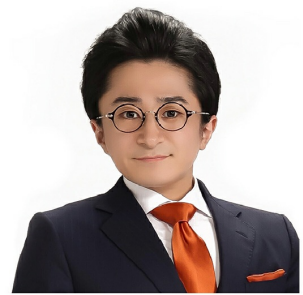
株式会社ミライロ 代表取締役社長

これまでの社会システムや社会に染み込んでいる価値観が「社会的弱者」という立場を生んでいるという視点を持ち、従来では行政が主に担ってきたとされるケアのサービスに、事業として取り組まれている方々をお呼びします。どのように社会システムを見直し更新しているのかや、誰もが公平なスタートラインに立ち、豊かな人生を生きる社会をつくることができるのかについて議論します。