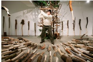
「根棒飛ばし」全日本根棒協会、東樫