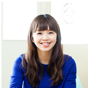
Community Nurse Company 株式会社代表取締役 一般社団法人 Community Nurse Laboratory 代表理事