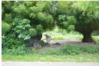
「曖昧なランドマーク」キュンチョメ