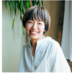
株式会社ソフトワーク カルチャーエグゼクティブ