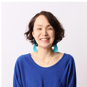
株式会社ファームステーション 代表取締役

企業としてESGに取り組んでいく際に、よくありがちな短期視点・直線思考を脱却し、土地や人と関係性を築き上げていくところから新しいビジネスの流れづくりに注力している方々をお呼びします。サステナブルなビジネスのあり方や他者との共創から生まれるイノベーションの可能性について議論し、未来の新常識になるような、新しい視点を提供していきます。