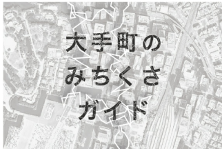
「大手町のみちくさガイド」studio TRUE