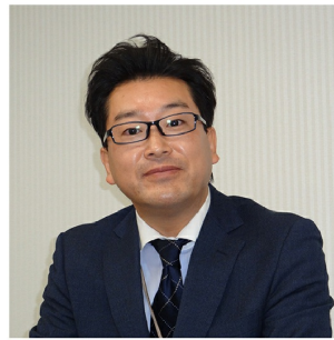
株式会社 TESS 代表取締役