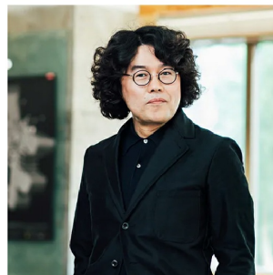
株式会社ソフトワーク 執行役員