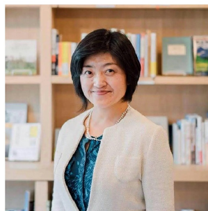
株式会社バリエーブックス 取締役・いい会社探求