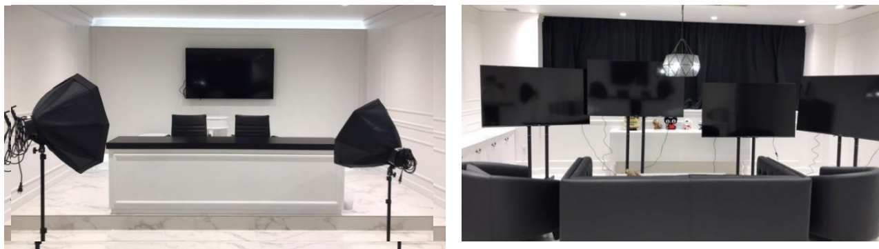
▲岐阜本社、ライブスタジオ

・グローバルに向けた最先端のマーケティング拠点「ライブスタジオ」を新設 新型コロナウイルスの影響で、海外拠点へ渡航してのマーケティング活動が難しい中、中国を中心に現在話題になっているライブストリーミング（生中継、ライブコマース）を行うことができる専用スタジオを設置しコロナ下でも海外販売を強化しています。日本はもちろん、グローバルに向けて非対面での情報発信を強化してまいります。