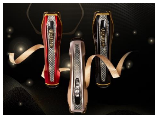
▲「ドクターアリーヴォ ザ ゼウス プラス」 165,000円(税込) (無料刻印サービス&限定 Holiday Box プレゼント)