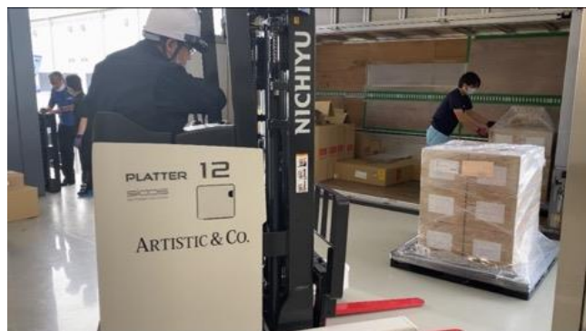
▲岐阜本社1階、配送倉庫