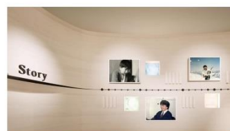
メモリアルコーナー