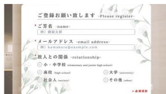
記帳・メッセージ入力