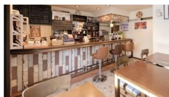
レストラン・カフェ