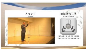
リアル会場との中継