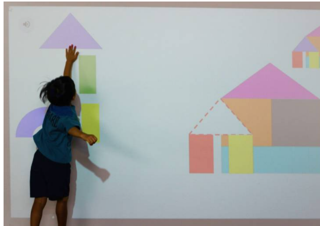
▲動きに合わせて映像が変化するデジタルタッチ