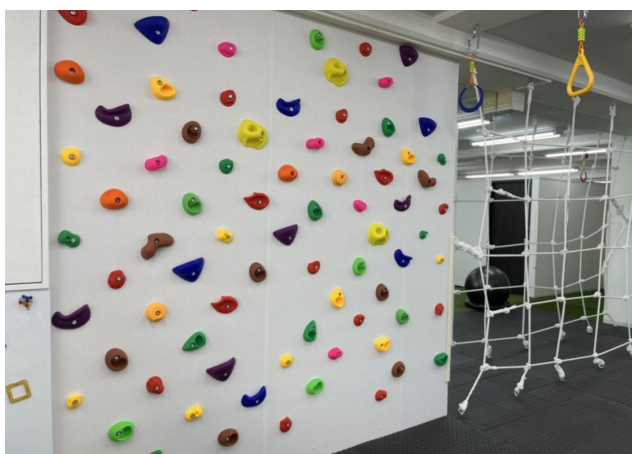
▲大きく手足を広げ体幹を鍛えるボルダリング

「7GYM」は、楽しく、思いのままに運動しながら7つの感覚を刺激する運動型児童発達支援・放課後等デイサービス施設です。五感に加えて、身体の位置や動きを感じる"固有受容覚" * 、重力や身体の傾き、スピードや回転を感じる"前庭覚" * などの発達に重要な感覚を刺激し、思いっきり体を動かしながら、神経系の発達や「できた!」の成功体験をつくり、子どもの心身の発達を促します。個人で遊ぶだけでなく、1時間に1回の集団運動プログラムも導入。ルールの理解や協調性、社会性を育みながら楽しくカラダとココロの発達を目指します。子どもたちが思いのままに楽しめるよう、特性に理解のあるコーチが常駐し、安全を守りながら適切にサポートします。