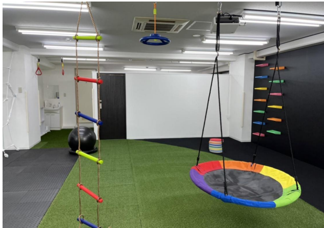
▲大小の揺れが前庭覚を刺激するぶらんこエリア