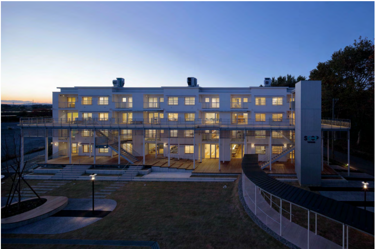
SCOP TOYAMA

「T-Startup Hour」は、主にT-Startupサポーター（スタートアップ支援に賛同する組織や企業）を対象にした対面式のリアルイベントです。富山県内外からゲストを迎え、「IPO・M&A」や「研究開発」、「デザイン」など、様々な切り口からサポーターの支援能力の向上や、スタートアップとのマッチングの機会を創出し、スタートアップエコシステムの形成を促進します。なお、イベントは富山県創業支援センター/創業・移住住宅「SCOP TOYAMA」で開催します。（開催に伴う詳細は後日ご案内）