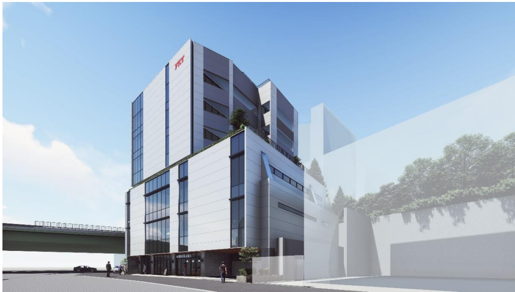
▲外観完成イメージ

公式WEBサイト： https://portalpoint.jp/yoyogi-koen/