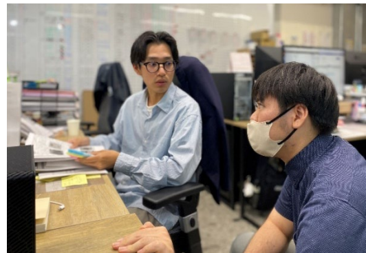
部署横断で業務改善・情報連携を強化