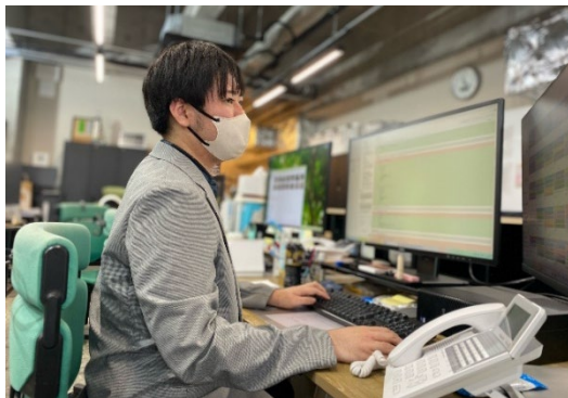
AI 活用・API 連携を通じた業務改善を推進