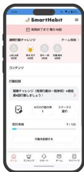
<プログラムイメージ>

本実証では、こうした課題を乗り越えるため、「楽しさ×UX×習慣化理論」を融合させた「 チームで楽しくとりくむ100日間『とみぐすく健康チャレンジ』 」としてプログラムを設計し、習慣化アプリを通じて、働き盛り世代の健康行動の定着とエンゲージメントの向上を図る支援を行いました。