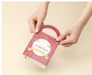
PRESENTERS ROOM 店頭