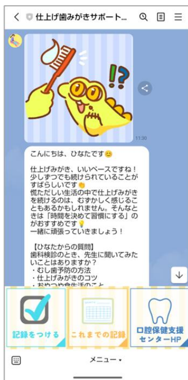
図1：サポートイメージ

那覇市の未就学児の親子を対象に、親子で楽しく、自然に、毎日続けられる「歯磨き習慣」の定着を目的として実施しました。LINEを活用した「仕上げみがきサポート NAHA」により、画像付きメッセージの配信と専属サポーターによる双方向コミュニケーションを通じて、保護者に寄り添う支援を行いました。