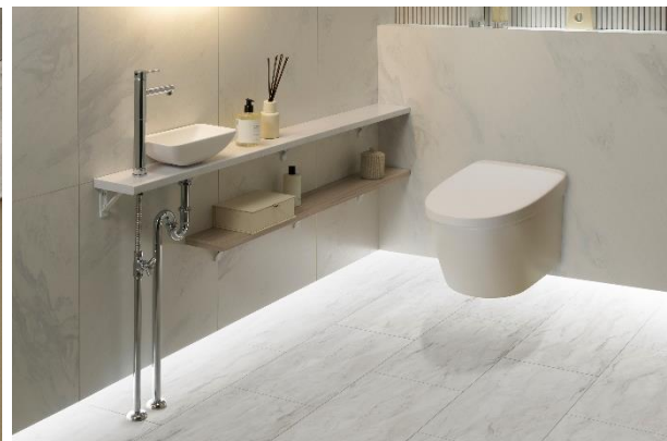
▲「メラノープル」施工イメージ