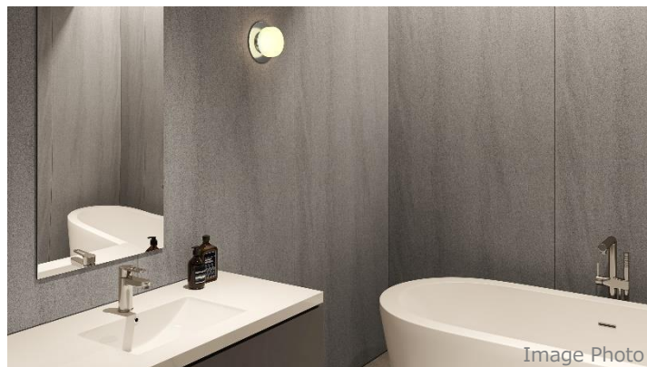
▲「バスフィットパネル」新柄の施工イメージ

ウェブカタログ URL： https://ebook.aica.co.jp/html/aicawebcatalog/58327/