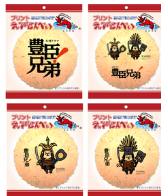
プリントせんべい