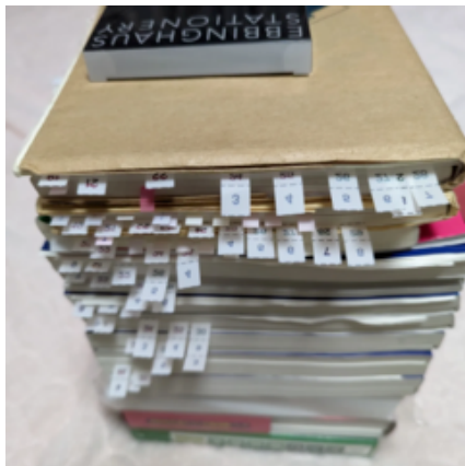
共通テスト×エビングハウスフセン