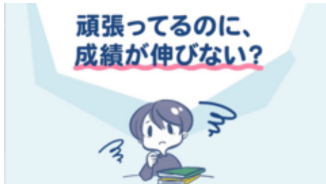
頑張っているのに成績が伸びない