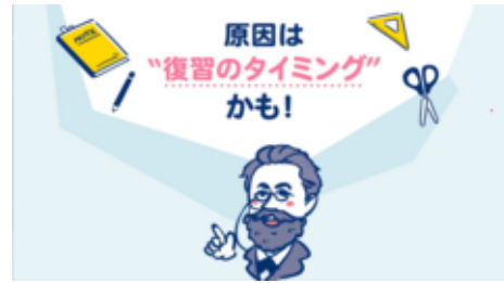
原因は復習のタイミングかも