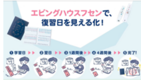
エビングハウスフセンで復習の見える化