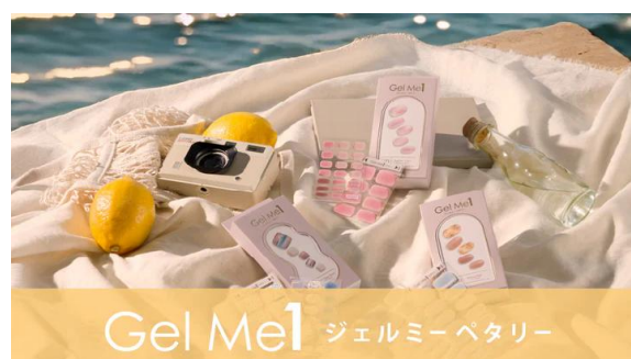
【ジェルミーペタリー】 貼る+硬化で簡単サロンクオリティ GelMe1 生まれのジェルネイルシール