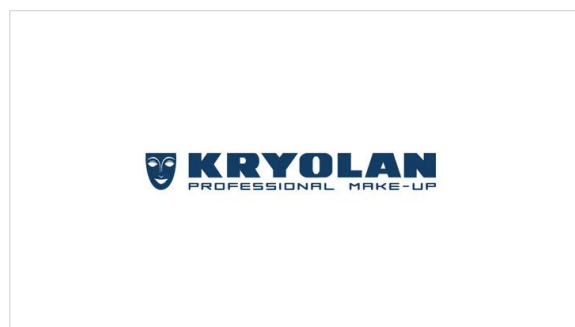
【クリオラン】 プロメイクアップアーティスト達に長年愛され 続けているドイツ生まれのメイクアップブランド