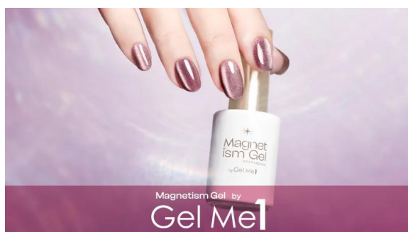
【マグネティズム ジェル】 『ジェルミーワン』から新たに登場した、 セルフで叶うマグネットジェル