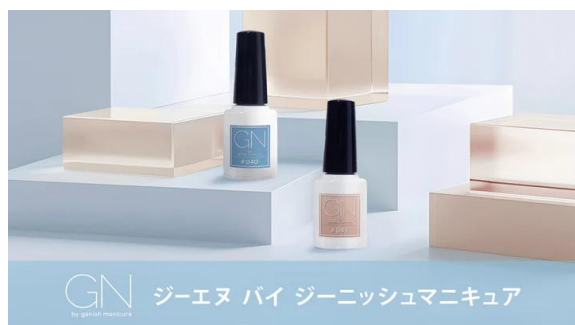
【ジーエヌバイジーニッシュマニキュア】 ワンコート 60 秒速乾 ジーニッシュマニキュアのプチプラライン