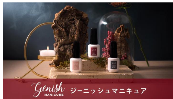
【ジーニッシュマニキュア】 ジェルネイル成分(光硬化樹脂)配合の ワンコート 60 秒速乾マニキュア