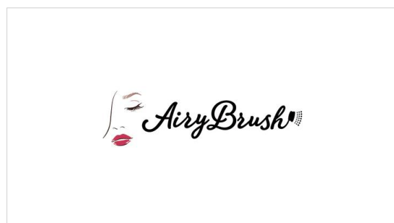
【エアリーブラシ】 テクニック不要で理想のツヤ美肌が叶う、 ポイントカバーにも使いやすいメイクブラシ