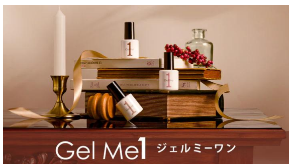
【ジェルミーワン】 おうちで簡単にサロン級のジェルネイルが 叶うセルフジェルネイル