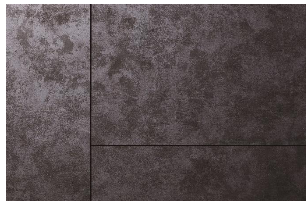
▲「セラール セレント」新柄の施工イメージ