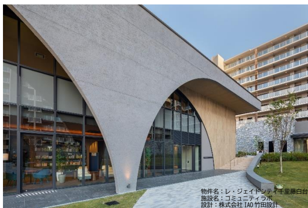
▲「クライマテリア ストンアートネオ∞」の施工イメージ

ウェブカタログ URL： https://ebook.aica.co.jp/html/aicawebcatalog/57996/#1