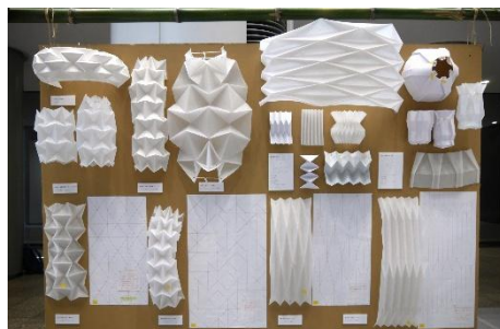
提灯のスタディプロセス展示