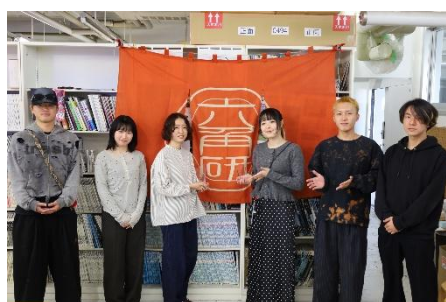
研究室での受賞報告