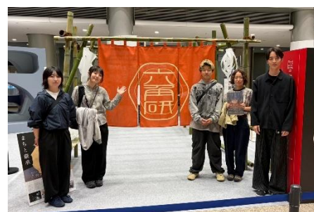
搬入後の集合写真