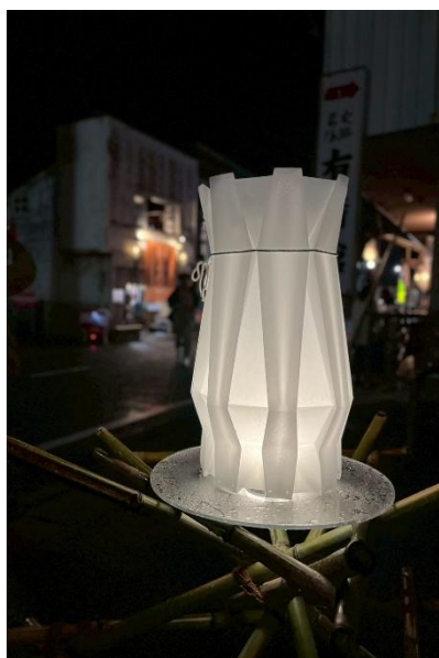
桶を表現した提灯