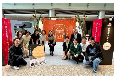
プレゼンテーション後集合写真