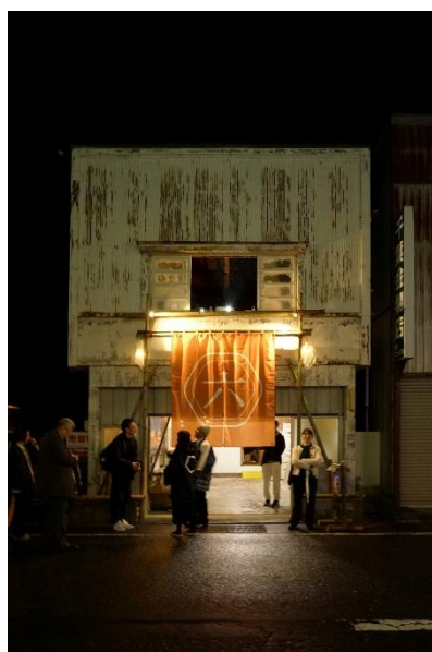
まちの店舗を活かして展示拠点に