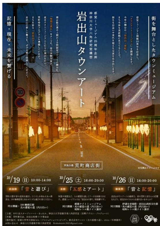
岩出山タウンアートポスター

2025 年 10 月 19 日（日）、25 日（土）、26 日（日）に宮城県大崎市岩出山地区の荒町商店街で開催される、時間をテーマにまち全体をミュージアム化し、眠っていた魅力や記憶を引き出す回遊型イベント「岩出山タウンアート」（主催：NPO 法人オープンハート・あったか、神奈川大学建築学部六角研究室 / 空間デザイン・プロデュース）内で、開館 25 周年を迎える感覚ミュージアムへ通じる道を提灯の光で繋げる「光の感覚の道」へ製作協力をいたします。このイベントはまちづくり活動として住民の方も参加して準備されており、企業のまちづくり活動への応援の一つの形となると考えております。今後も、製作協力などの様々な形で、教育活動などへ協力していきたいと考えています。