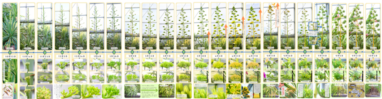
アガベ・ベネズエラの成長の変遷