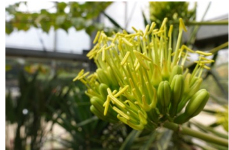
2025年4月の開花時の様子