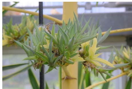
2025年10月2日現在のアガベ・ベネズエラと、花茎についた子株