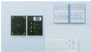
ミシン目3本入りPETふせん(31日用)