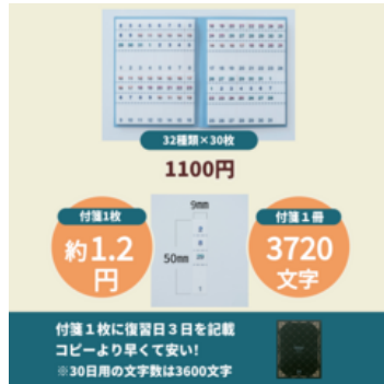
PETふせん版エビングハウスフセン