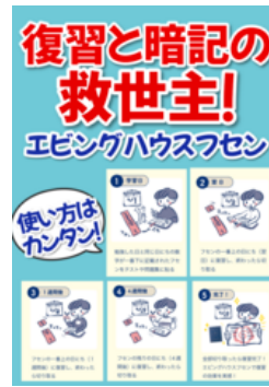
エビングハウスフセンの使い方