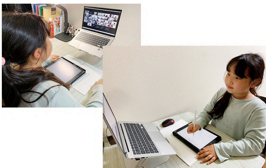
(左: Zoomで授業を受ける様子、右: iPadに書き込む様子)

また、MetaMoji上で生徒同士の回答を共有し合う場面では、クラスメイトの気づきや発想に触れる機会が多く、学び合いの中で理解が深まる仕掛けも構築しており、こうしたICTの活用はあくまで“花まるの目”を補強するための手段であり、「一人ひとりを見逃さない」姿勢が根本にあります。