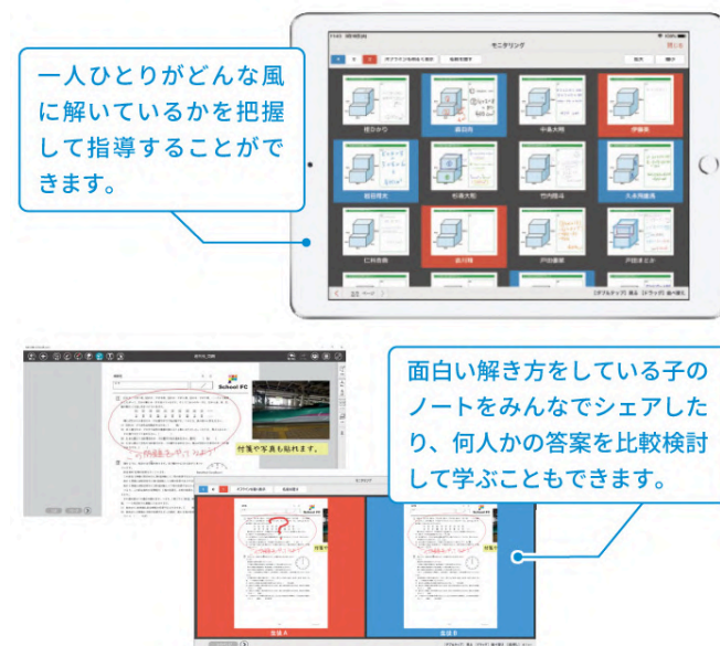
(画像:リアルタイムに解答情報や解き方を共有している様子)

このように、「家庭と学びの接点が日常的に保たれる」ことは、孤立しがちな子育てへの確かな支援にもなっています。