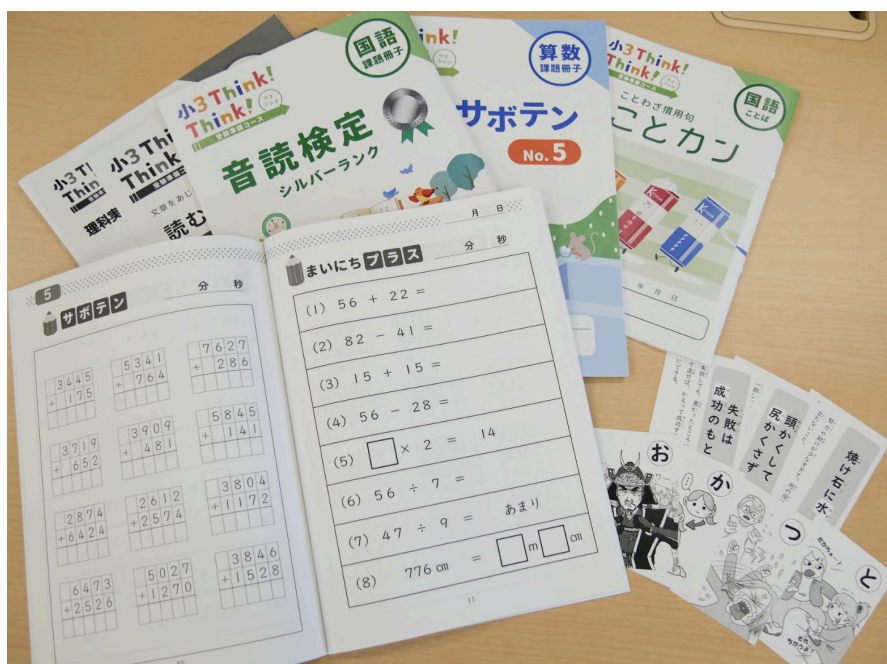
(スクールFCのオリジナル教材)