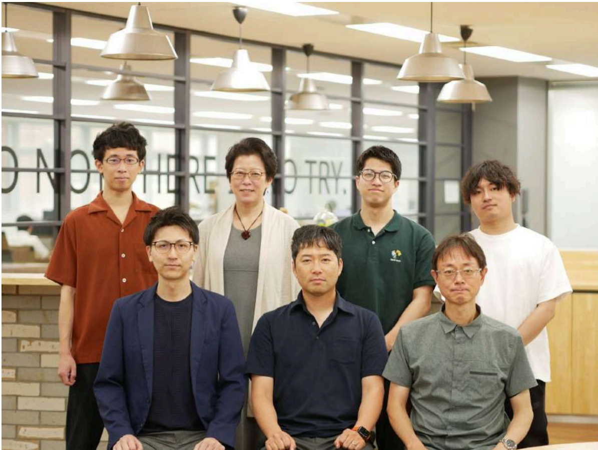
＜認定取得に貢献した「0-WAN」エンジニアのメンバー＞

「DSA (Delivery Services Authorized) パートナー」は、Zscalerが定めるベストプラクティスに沿って高品質な設計・構築作業を実施できるパートナーとして、同社より認定される制度です。