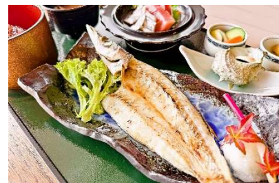
施設提供の入居者専用朝食メニュー例