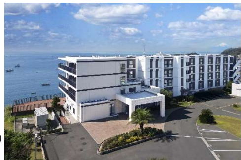
相模湾を望む絶景の地に佇む「マゼラン 湘南佐島」。晴れた日には富士山まで見渡せるロケーション

名 称：マゼラン 湘南佐島 所 在 地：神奈川県横須賀市佐島 1-14-1 類 型：健康型有料老人ホーム 入居開始：2022 年 12 月 入居条件：60 歳以上・自立 居 室 数：50 室（1 階、3～5 階／全室オーシャンビュー） ホームページ： https://mazeran-web.com/sajima/