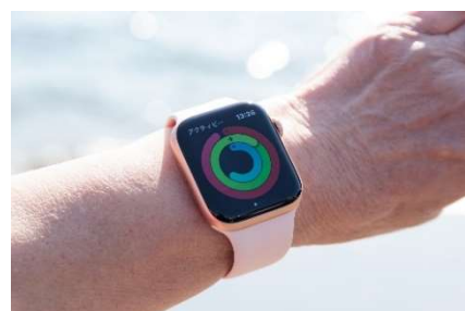
入居者とスタッフ全員が Apple Watch を日常的に着用。日々の歩数や睡眠などのヘルスデータを日々“見える化”。

今回の検証では、乳性飲料の継続飲用を加えることで、入居者とスタッフ双方の行動変容を促すことを目的としました。