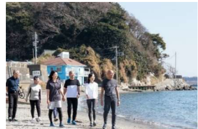
海とともに始まる一日。毎朝 2,000 歩のビーチウォーキングで整える、健やかな生活リズム。