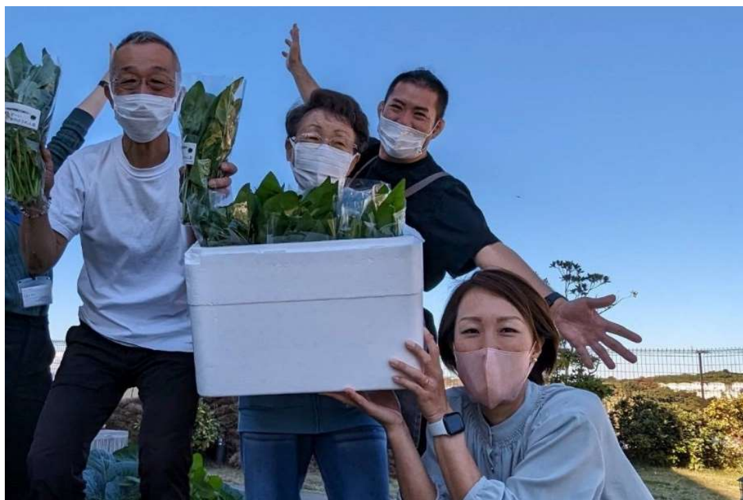
収穫を楽しむひとときも、前向きな健康習慣の一環。スタッフと共に育む、「マゼラン 湘南佐島」の豊かな日常

健康型有料老人ホーム「マゼラン 湘南佐島」（所在地：神奈川県横須賀市、運営：株式会社 SOYOKAZE）では、アサヒ飲料株式会社（以下「アサヒ飲料」）と共同で、睡眠の質向上が期待される CP2305 株を含む乳性飲料* 1 の継続飲用と Apple Watch* 2 などで記録する日常データの可視化を組み合わせ、入居されるお客さま（以下「入居者」）およびスタッフの健康行動の変化を検証しました。