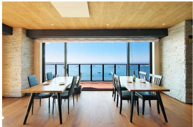
地域に開かれた施設として一般利用可能なカフェ(左)のテラスからの夕景、海を一望するレストラン(右)