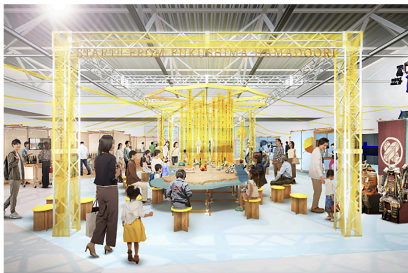
▲「福島復興展示」イメージ図

今回は、万博の「テーマウィーク」の一環で、復興庁・経済産業省合同展示「東日本大震災からのよりよい復興(Build Back Better)」内にて開催する、経済産業省主催の福島復興展示「FUKUSHIMA FUKKO-TRANSFORMATION: F-X」において、浜通りの起業家たちが地域での新規事業や新商品などをパネル展示、トークセッション、販売・試食・試飲コーナーなどを通じて、“自立型復興”の最前線として紹介します。