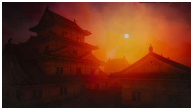
本作オリジナルの和風の城