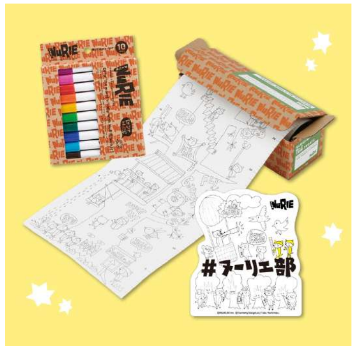
賞品：NuRIE スペシャルセット