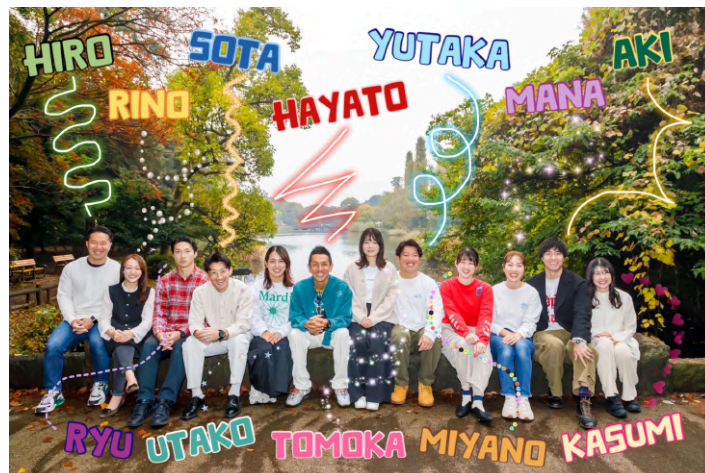
▲フリースクール『花まるエレメンタリースクール』の先生たち

当スクールは、24名でスタートした後、2025年4月現在の児童数は120名まで拡大。各地から多くの問い合わせや入学希望が寄せられており、新たな拠点の開校が急務となっています。