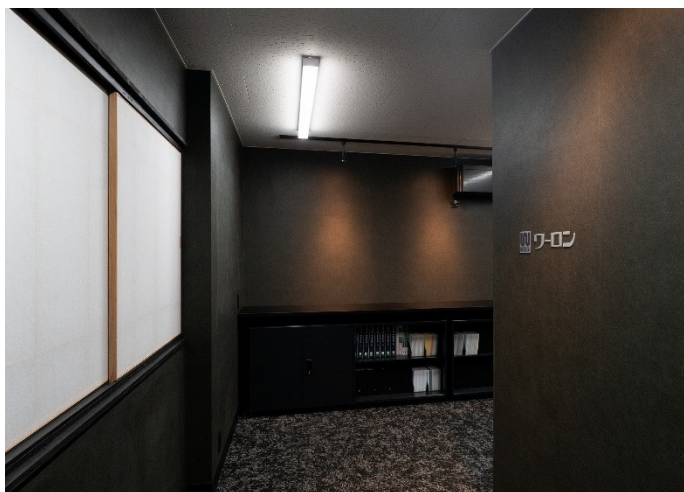
製品を活かす黒基調のインテリア