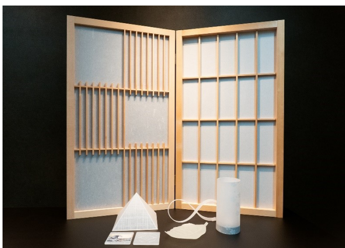
素材の特長、用途事例を実際に確認